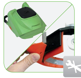
Tank kan gemakkelijk verwijderd worden om de interne delen van de machine te controleren.