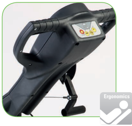
Gebruiksvriendelijk, dankzij intuïtief bedieningspaneel.