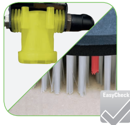
Geel gemarkeerde servicepunten voor eenvoudig dagelijks onderhoud. Borstel met gebruiksindicator.