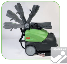
In de hoogte verstelbare duwbeugel, ook tijdens het gebruik.